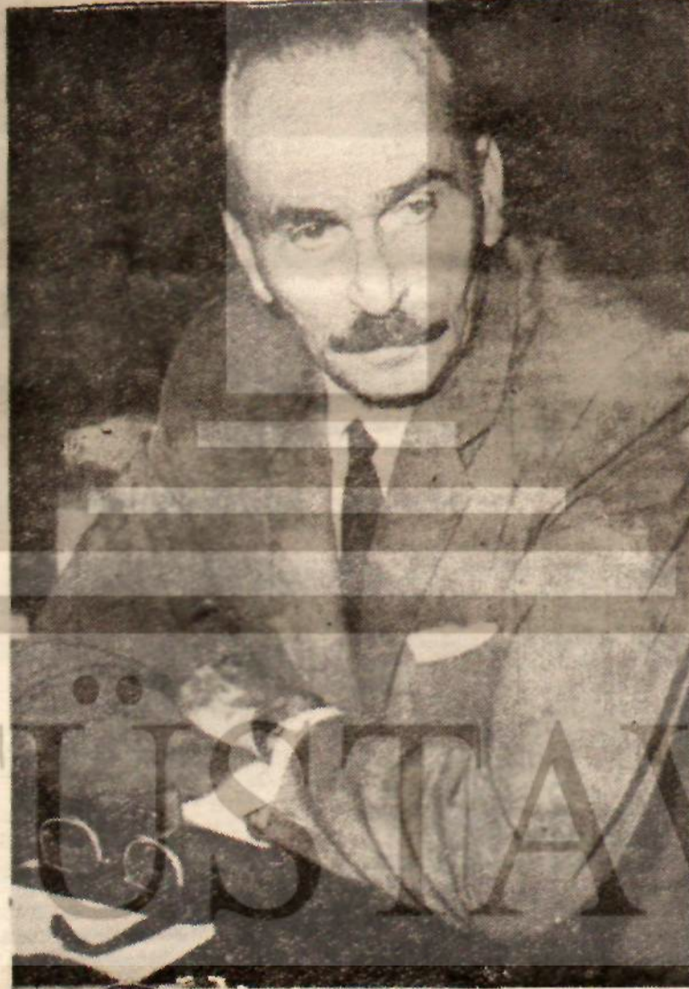
MEHMET ALİ AYBAR

BU SAYFADAKİ BAŞLIK VE ARABAŞLIKLAR «SOSYAL ADALET» TARAFINDAN KUNULMUŞTUR